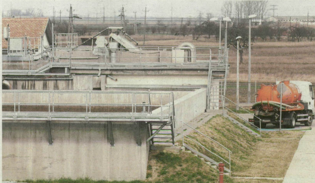
A szennyvíziszap értékesebb a műtrágyánál, mégsem készítnek belőle komposztot.

Ez derül ki most Makón is. A képviselő-testület legutóbbi ülésén arról folyt a szó, hogy a mostani tisztítóban évente 2000 tonna szennyvíziszap keletkezik, amit eddig a szeméttelület gondozó Bio-Pannónia Kft. tonnáként 2000 forintért vett át és helyezte el. Most a hulladékgyűjtésre kiírt közbeszerzést egy másik cég, az A.S.A. Hódmezővásárhelyi Kft. nyerte el, a mostaninál 20 százalékkal olcsóbb szemétdíjért. A vásárhelyi vállalkozás azonban a makói iszapot 8000 forintért venné át, és ebben az összegben a szállítás ára nem is szerepel. A makói önkormányzat az iszapot – amelynek mennyisége a mostani csatornaberuházás után évi 5000 tonnára nő – olcsóbban szeretné elhelyezni valahol. Felmerült, hogy a Makói Oktatási Központ által használt 80 hektáros állami földön lehetne használni, trágyaként. Ez úgy-