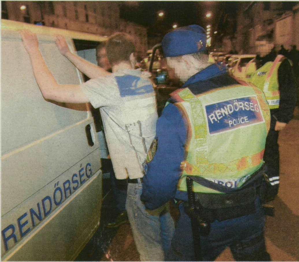
A rabszállítók szinte az egész Kálvária sugárutat elzárták.

klub előtt hatalmas a sor, mindenki bulizni akar. Rabszállítók érkeznek a Kálvária sugárúti diszkó elé, gyakorlatilag elzárják az egész utcát. A rendőrök bevonulnak, felkapcsolják a lámpákat, elnémul a zene. Gyors ellenőrzés után mindenkit a táncter-