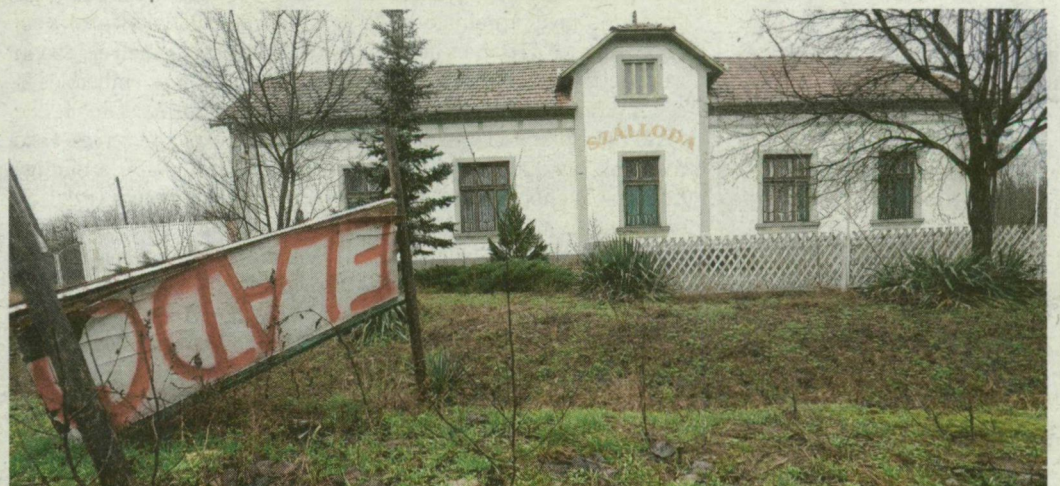
Már egy Eladó tábla is fejere állt a régi 5-ös út mellett.

CSONGRÁD MEGYE. 2007-re gyakorlatilag harmadára csökkent a forgalom az 5-ös főúton: míg a Magyar Közút Zrt. forgalomszámlálási adatai szerint 2005-ben naponta 16 ezer jár-