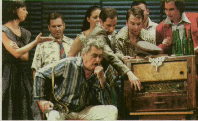
A retro hangulatot a jelmezek és díszletek is erősítették.

Még úgy sem, hogy maga Fenyő is csupán 7 esztendő volt az 54-ben elvesztett berni vb-döntő idején, és dalai inkább a 60-as, 70-es évek légkörét idézik meg, semmint a zaklatott 1950-es esztendőket. De ha a néző hagyja magát, a Minden kocka fordul, a Subidubi május elviszik egy édes-bús kirándulásra. Népstadion (ma már Puskás Ferenc nevét viseli), válogatott