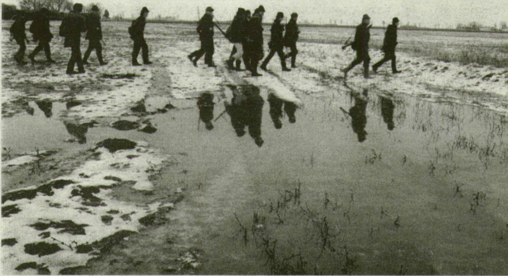
Puskával indulnak vadettetésre a vadászok. A gazdák az utakra vonulnak.

„A kutyaiskolákban őrző-védő és munkakutyákat, sportkutyákat képzünk ki, külön szekciója lesz többek között a társasági, a vadász-, a szánhúzó és a