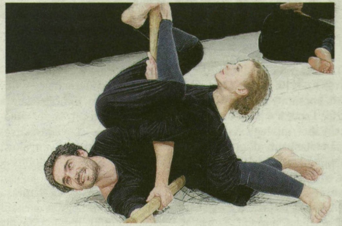
Jelenet a Maladype Színház Leonce és Léna-alkotásából.

Felbolydult Szeged kultúrára éhes közönsége a Maladype Színház hétfői vendéjátékának hírére: a REÖK-ben színre kerülő Leonce és Léna előadásra rohamosan fogynak a jegyek. Annak sem kell aggódnia, akinek erre a darabra nem jut belépő, hiszen még négygel vendégszerepel a társulat.