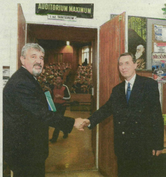
Csak a kézfogás volt nyilvános, a vita nem.