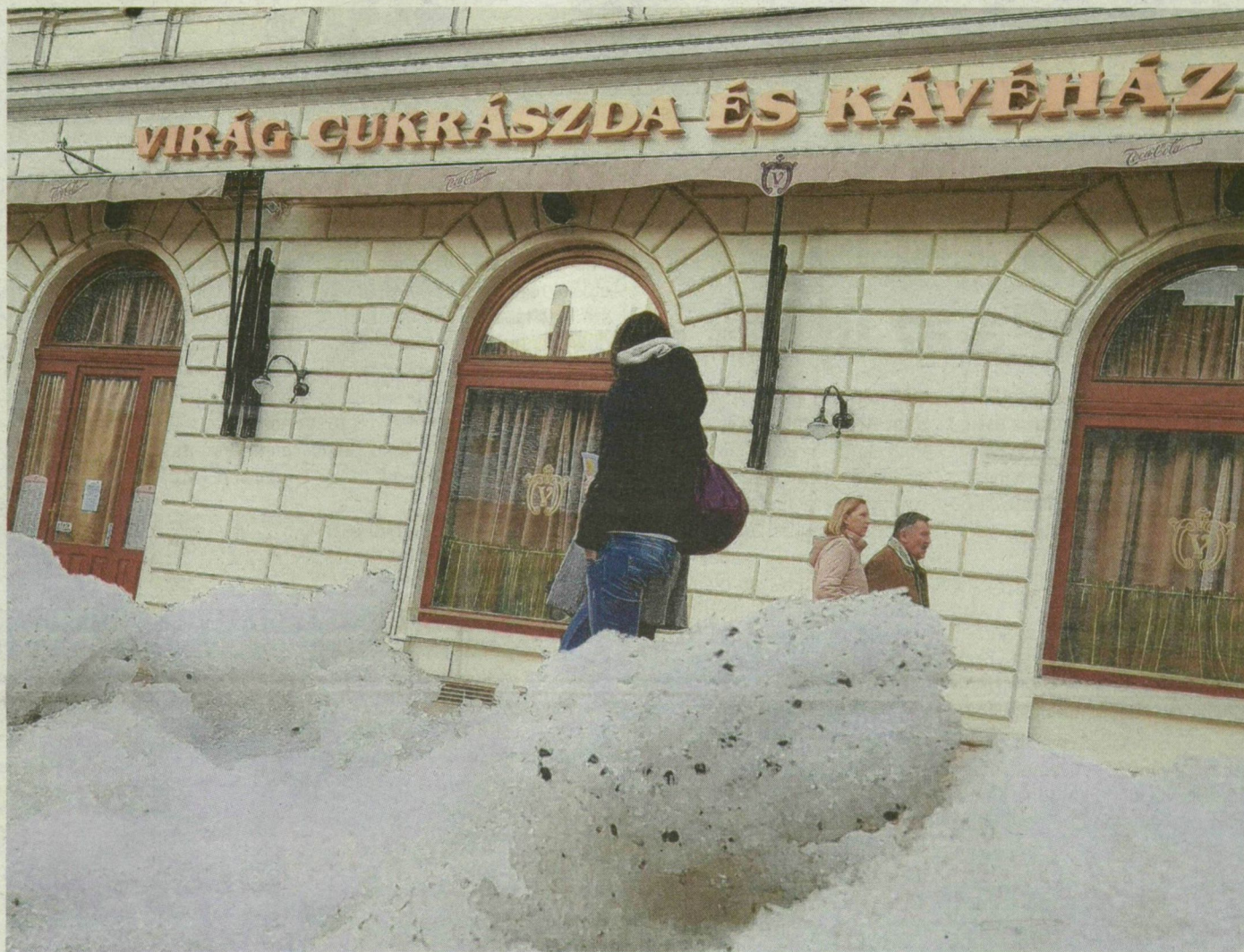
A hó nem akadályozza a nyitást – a félmilliárdos tartozás annál inkább.