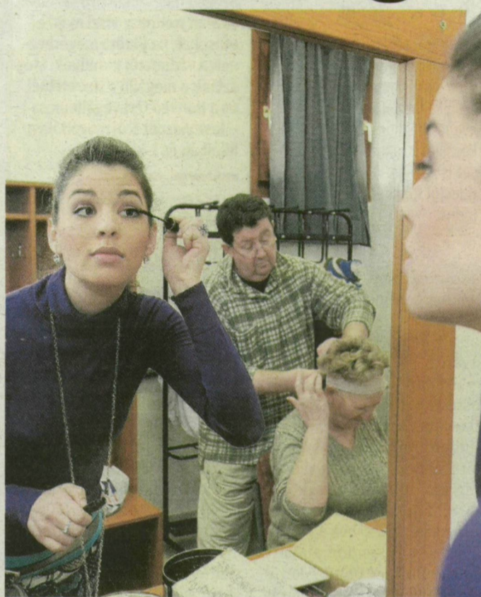
Erősebb smink kell, mint a tévében – vallja a sztár.