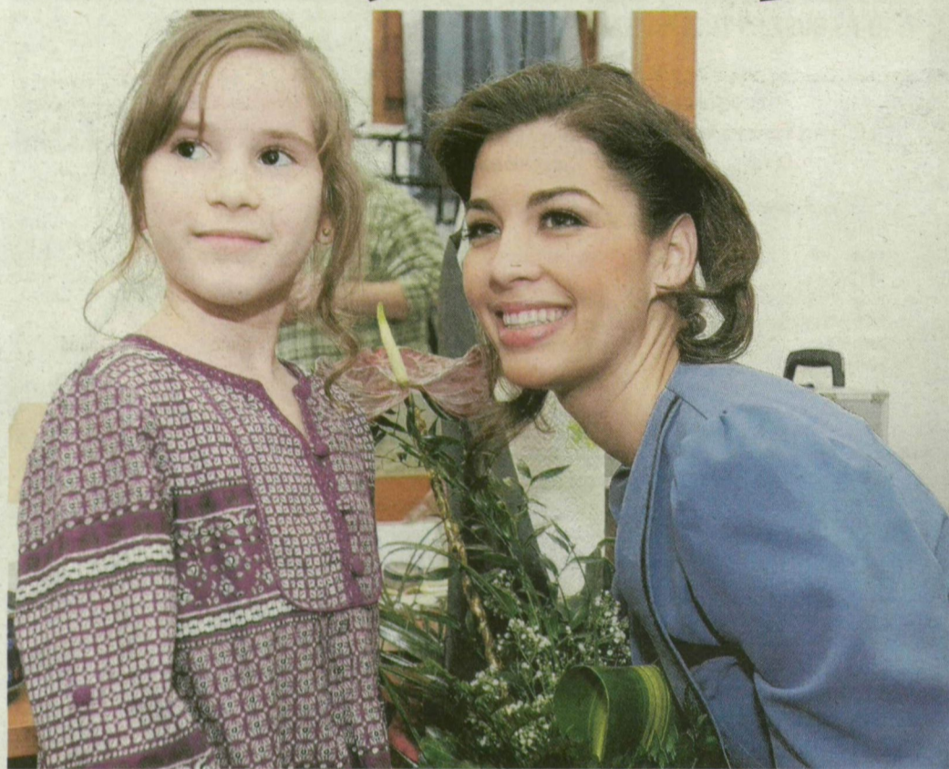
Energát gyűjt az előadásokból és a mórahalmiak szeretetéből Ördög Nóra.