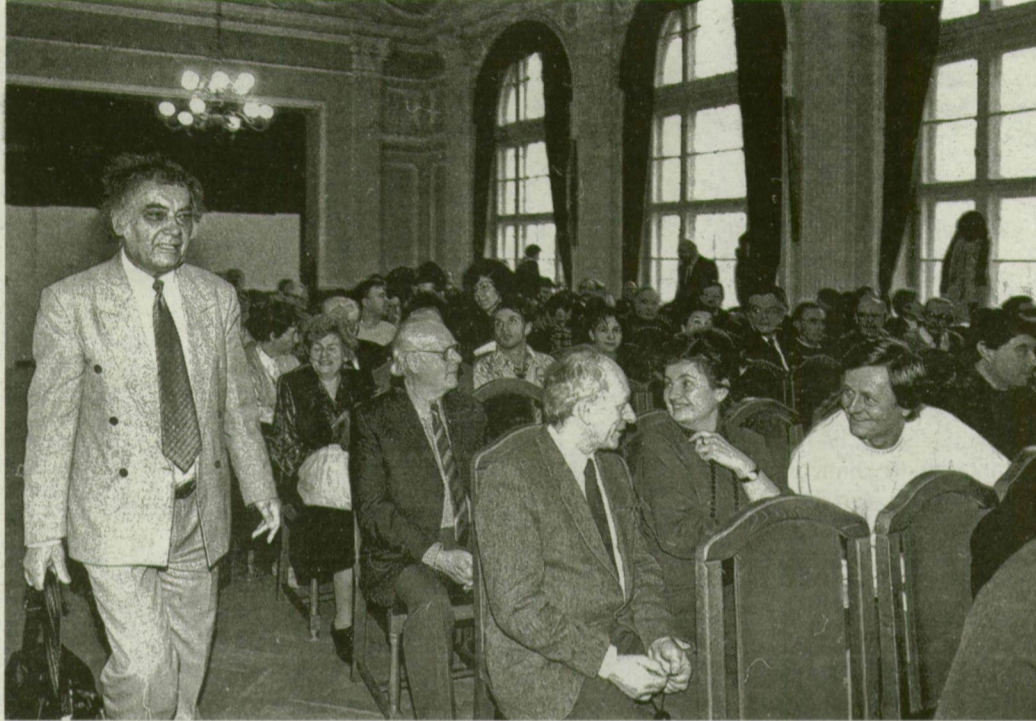
A szegedi egyetemen a Magyarok Világszövetségének elnöke, Csoóri Sándor szerint a szétszórt nemzet gondolataiban is szétszórt.