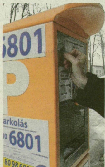
Ha bepárasodik az automata pénzbedobónyílása, átpotyog rajta az aprópénz.