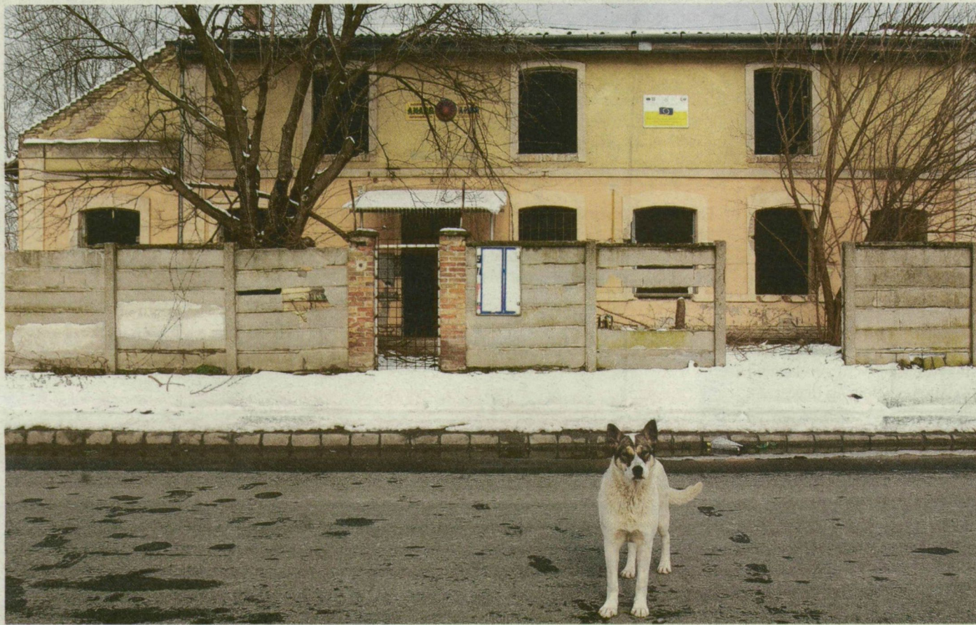
Igy fest ma az egykori cigány közösségi ház és környéke. A kutya sem érti, mi történt.

Legalább 12 és fél millió forint veszett kárba azzal, hogy az Amaro Kher cigány közösségi ház az enyészete lett. Az épületet most telekárón, 20 millió forintért hirdette meg értékesítésre az IKV Zrt. Hogy a közel 80 ezer eurós pályázati összeg hova tűnt, továbbra sem tudni.