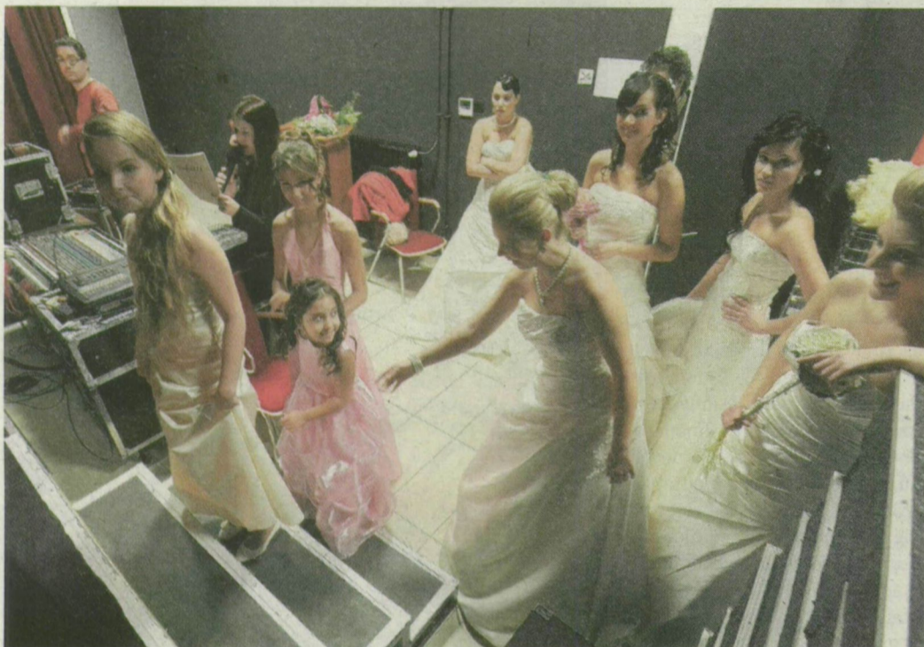
Az idei menyasszonyiruha-trendből adtak ízelítőt a csinos modellek.