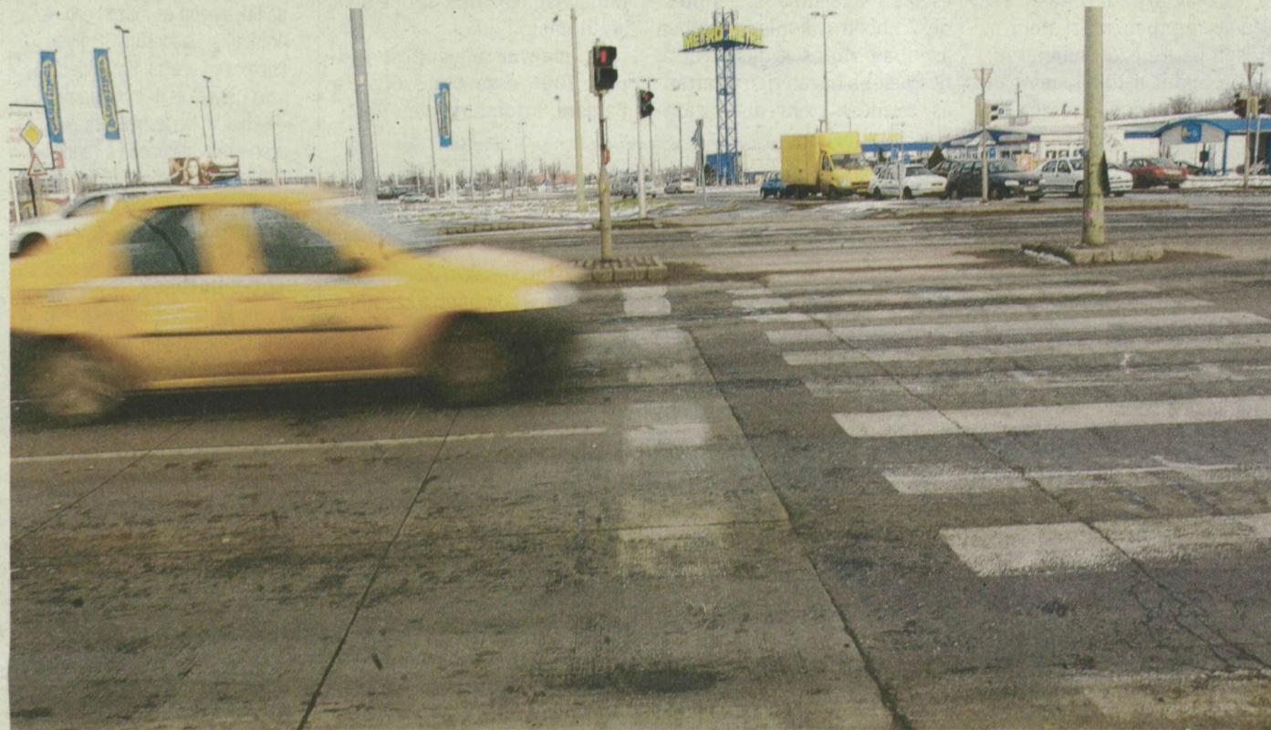
A Cora Áruháznál lévő lámpás kereszteződés közelében 70 méteren betonnól van az út. Itt tartunk.

Tizenkét év múlva várhatóan fel kell újítani a most készülő M43-as szakaszt: addigra tönkremegy az aszfalt kopórétege. Nyugat-Európában régóta betonnól építik az ilyen autópályákat, amelyekhez harminc-nyolcvan évig nem kell hozzányúlni, ezért is olcsóbbak. Mi ilyet miért nem tudunk?