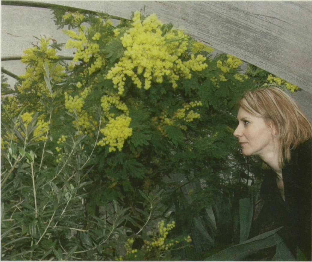
Aki látni szeretné az ország legnagyobb mimozafájának virágzását, még ebben a hónapban látogasson el a fűvészkertbe.