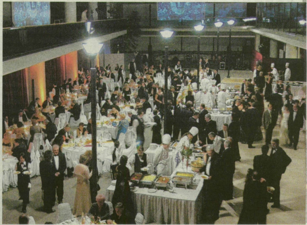
Idén is a TIK ad otthont a Lions-bálnak.

A Szeged Első Lions Club és a Szegedi Tudományegyetem szombat este hét órától rendez meg közös jótekonysági bálját az SZTE József Attila Tanulmányi és Információs Központban. Az elmúlt évhez hasonlóan az idei farsangi szezonban is a társasági élet kiemelkedő eseményének ígérkezik az elegáns estély. A gazdag prog-