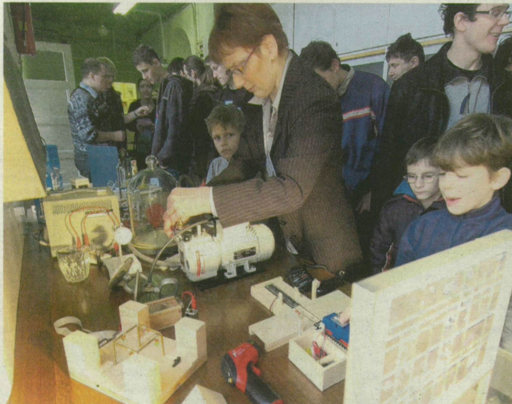
Idén is százakat vonzott a fizika napja a Szegedi Tudományegyetemen: az érdekes kísérletek a gyereket és a felnőtteket egyaránt lekötötték.