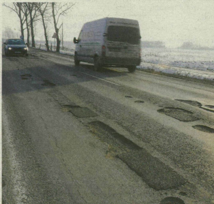
A kátyúk miatt lassabban kell közlekedni Vásárhely és Barattyos között, a 45-ös főúton.

Kritikussá vált az egymást érő – néhol több mint 10 centiméter mély – kátyúk miatt a közlekedés a 45-ös főút Hódmezővásárhely és Barattyos közötti, 2,5 kilométeres szakaszán. Az utat folyamatosan javítja a közútkezelő, de az előregedett szakaszt teljesen fel kellene újítani.