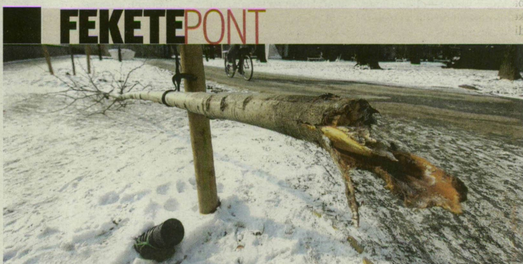
Könnyű célpont a facsemete , az átlagember mégis mindig meglepődik, amikor azt látja, hogy kitörnek egyet. Pillanatnyi elmezavar? Keménykedés? Düh? Bármilyen volt az ok, nincs rá mentség. Mi csak annyit tehetünk, hogy felhívjuk rá a figyelmet, és fekete pontot adunk érte. Ezt a fát a Roosevelt téren, a múzeum előtt törte ki valaki.

és az R-GO Gidák. A bál napján a hagyományos tudományos ülésen az aktuálisnak ítélt jogi vagy szervezeti témákat tárgyalják. Péntek délelőtt 10 órai kezdettel a Szegedi Akadémiai Bizottság Somogyi utcai székházában rendezik meg azt a tudományos előadást, amelyen Paczolay Péter , az Alkotmánybíróság elnöke tart előadást Az élő alkotmány: az alkotmánybíráskodás állandósága és változásai címmel. A jogászbálon csütörtökön még lehet jegyet venni a Csongrád Megyei Bíróság szegedi, Széchenyi téri épületében, 13.30-tól 15.30-ig.