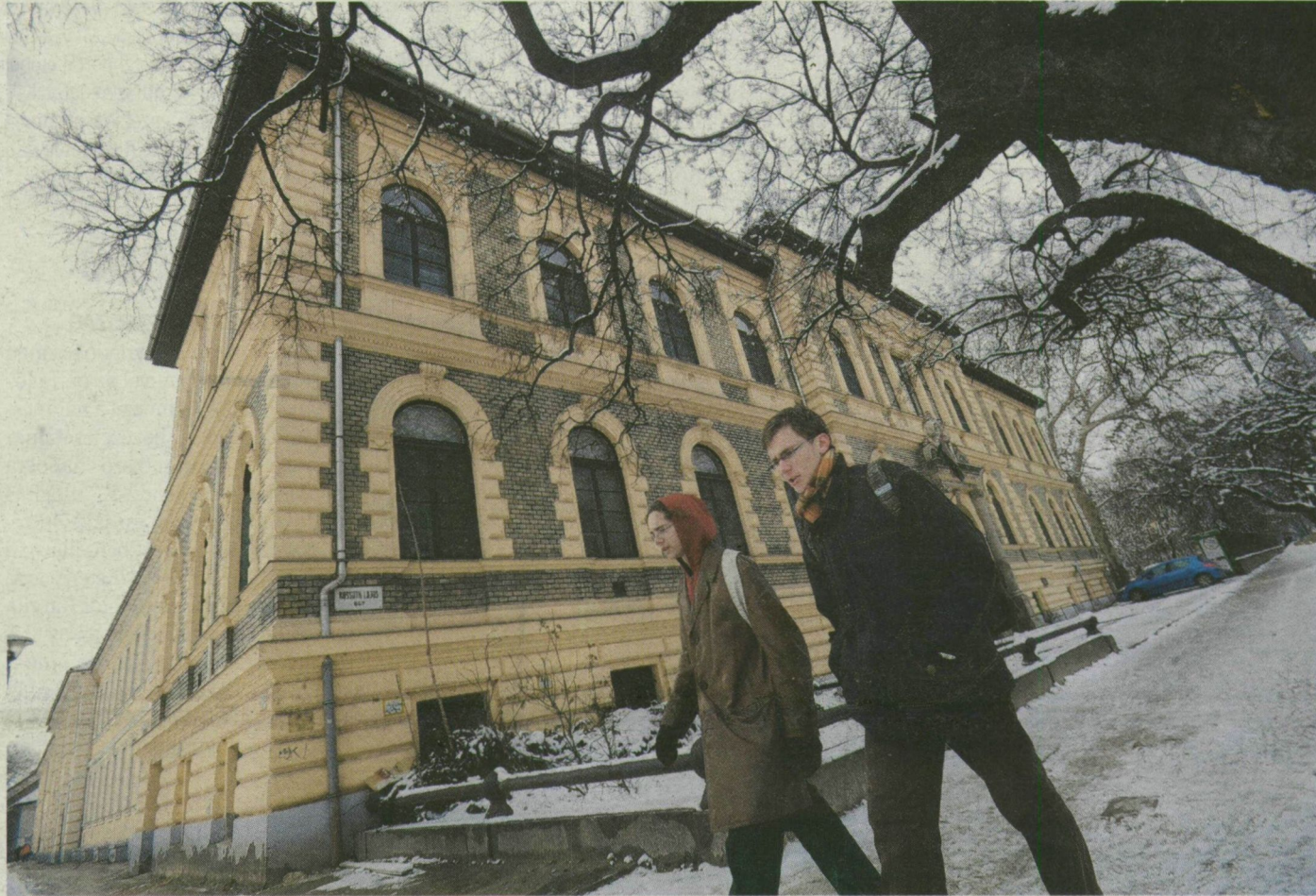
Becslések szerint 1,2 milliárdot ér az I-es kórház. Még nem tették ki az eladó táblát.