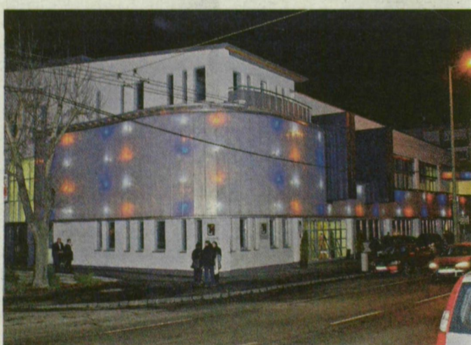
Több bálnak is otthont ad az IH Rendezvényközpont.

A Rotary Club Szeged-Tisza tagjai is ma este báloznak, ők a Tisza Hotel koncerttermében gyűlnek össze. Ötödik alkalommal rendezik meg álarcos báljukat, amelynek bevételét karitatív célokra fordítják. Többek között iskolákat, rászorulókat, határon túli magyarakat támogatnak.