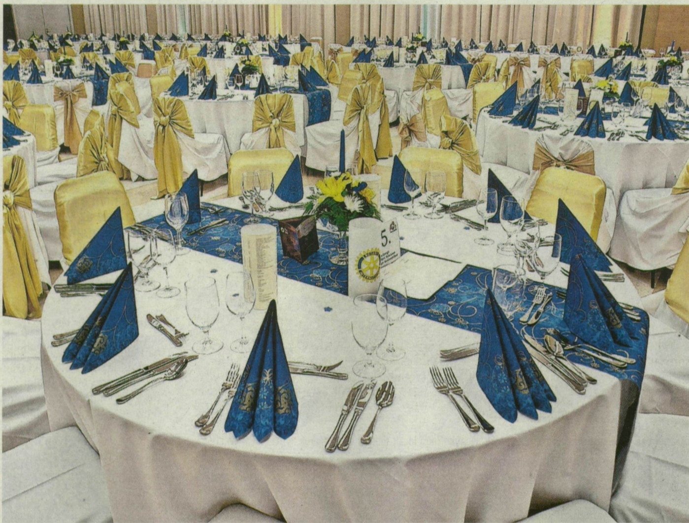
Kék, arany és fehér. Gyönyörűen megterített asztalok a Rotary-bálra.