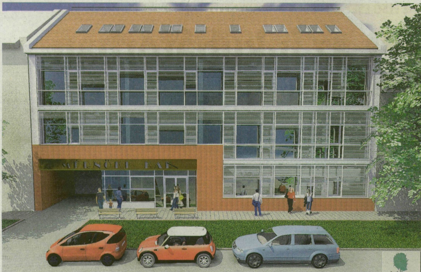
Egy év múlva új, XXI. századi mintaépület szolgálja a mérnökképzést Szegeden. LÁTVÁNYTERV