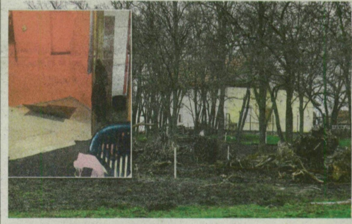
A tanya, a kis képen pedig a bunker lejárata látható.

és fél év szabadságvesztésre ítélték közlekedési baleset okozása miatt. Munkatársaink felkeresték a tanyát, amelynek tulajdonosa csak annyit árult el: a szomszédok értesítették arról, hogy „nagy a mozgolódás a tanyájában”. Úgy tudjuk, a rendőrség ellene is eljárást indított bűnpártolás miatt. Részletek a 4. oldalon