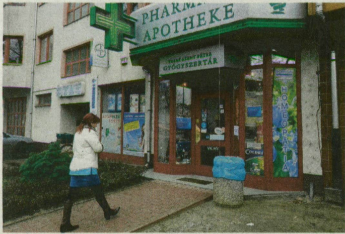
A Kossuth Lajos sugárúti építkezés miatt sokan nem találták meg az ügyeletes Vasas Szent Péter Gyógyszertárt.

Tanulnia kell a betegeknek a szegedi ügyeletes gyógyszerháza rendet. A múlt év júniusának közepétől új a szisztéma: Szegeden a Kígyó, majd a plázabeli patika se vállalta egyedül a veszteségesnek mondott állandó ügyeletet. Azóta