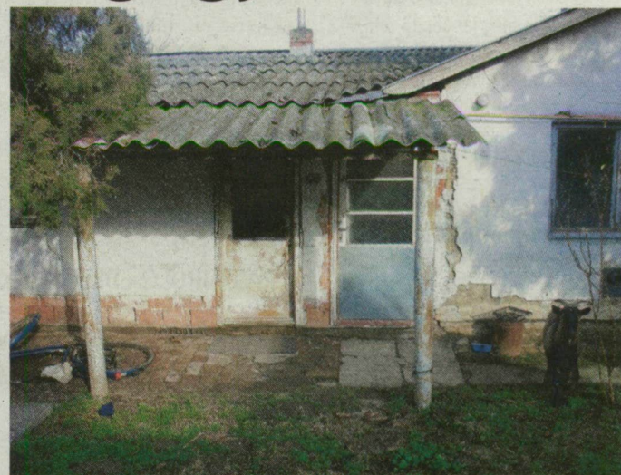
Ebben a házban, rossz körülmények között élt Sz. Miklós.

Kihűlt Makón egy 60 éves férfi saját, Földeáki úti házában. A holttestet szombaton fedezte fel egy rokon. A szomszéd szerint a férfi elhanyagolta magát.