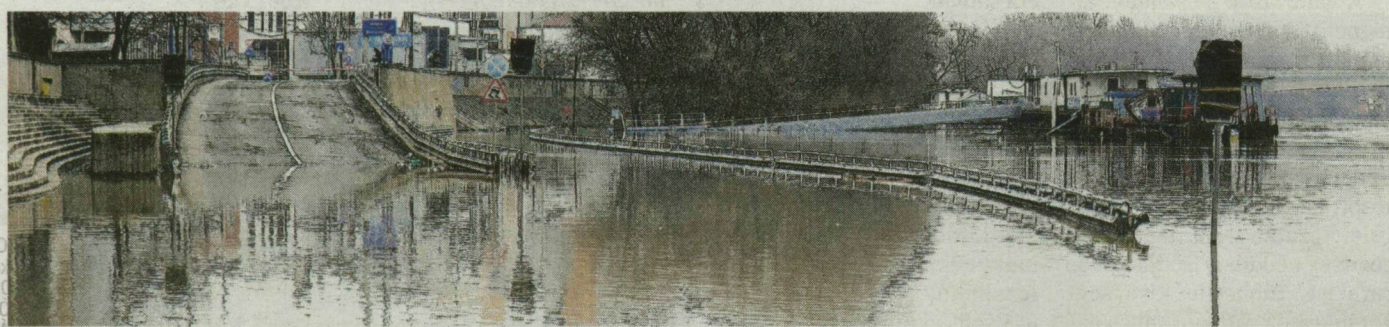
Szegednél szerdánig még nőhet a víz – várhatóan 640 centiméternél tetőzik a folyó.

Szolnok és Békés megye egy része – összesen 31 ezer hektár van víz alatt. – 22 szivattyúteleppel napi 1,5 millió köbméter vizet emelünk át a Tiszába és a Marosba. Ez a mennyiség nem súlyosbítja az árvízhelyzetet. Jelenleg két településen – Makón és Kunszentmártonban – rendeltünk el belvízvédelmi fokozatot. Makó környékén a belvív már lakóingatlanokat is fenyeget, de tudomásom szerint még senkit nem kellett kitelepíteni. A védekezésben 64 munkatársunk vesz részt – tette hozzá az Atikövizig vezetője.