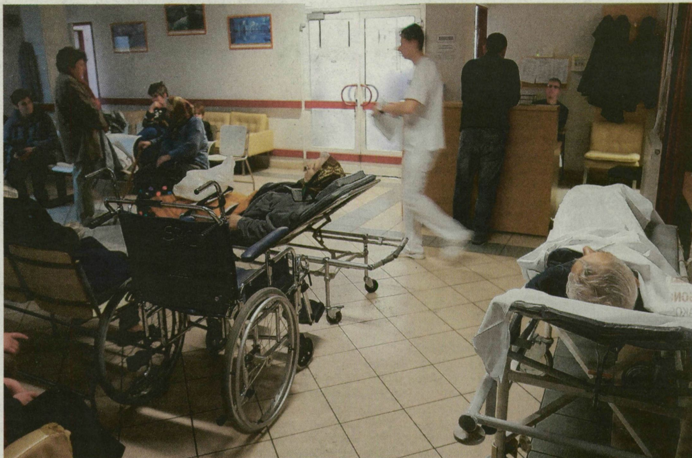
A szentesi kórház csak a fenntartó megyei önkormányzat pénzügyi segítségével élte túl a tavalyi évet. A most utalt OEP-pénz csak töredéke az elvont összegnek.