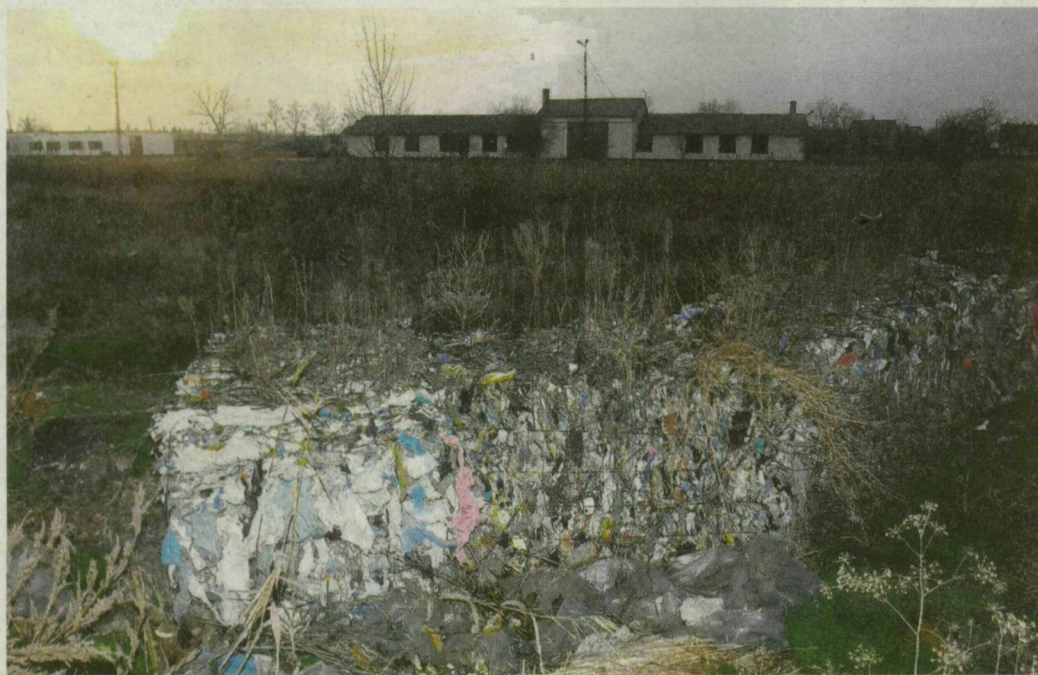
Vajon a város nyakán marad a 26 tonna háztartási hulladék?

A mindszei önkormányzat perelni akarja a német szemétbálák ügyének magyar szereplőjét, mert a kisváros nem nyugszik bele, hogy a nyakán maradt 26 tonna háztartási hulladék.