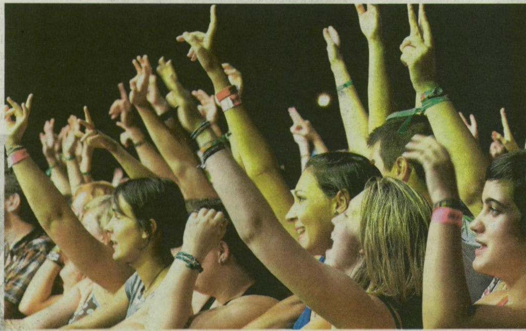
Az idei SZIN – amikor még teljes volt a hangerő.