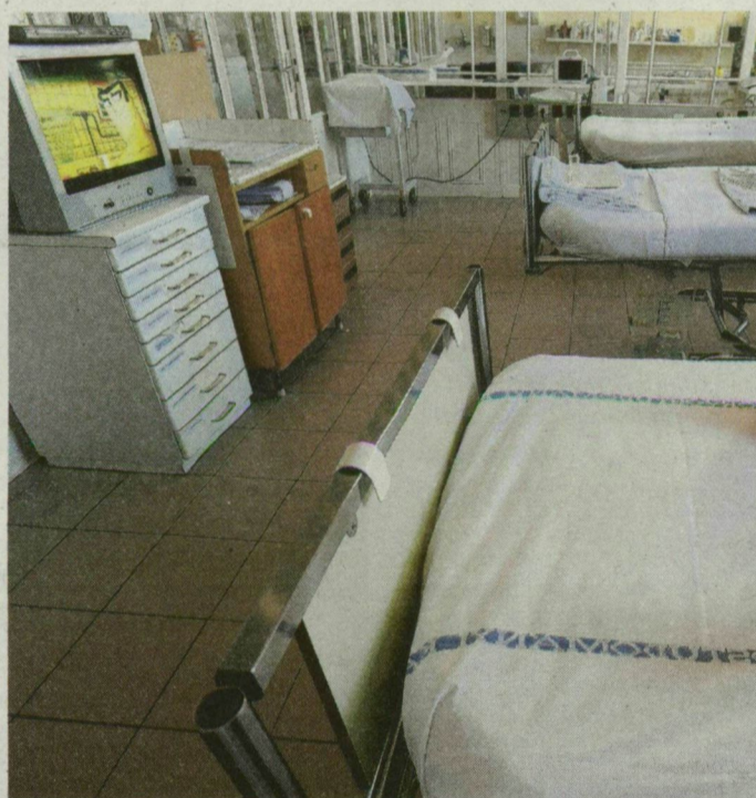
A gyermekklinikára eddig 84 H1N1-fertőzött beteget vettek fel szeptember óta.