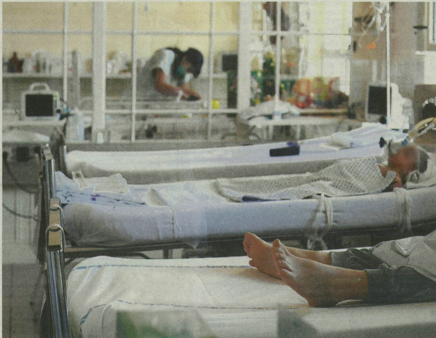
A szegedi gyermekklinikára intenzív osztályán a krónikus beteg új influenzás kicsiket kezelik.