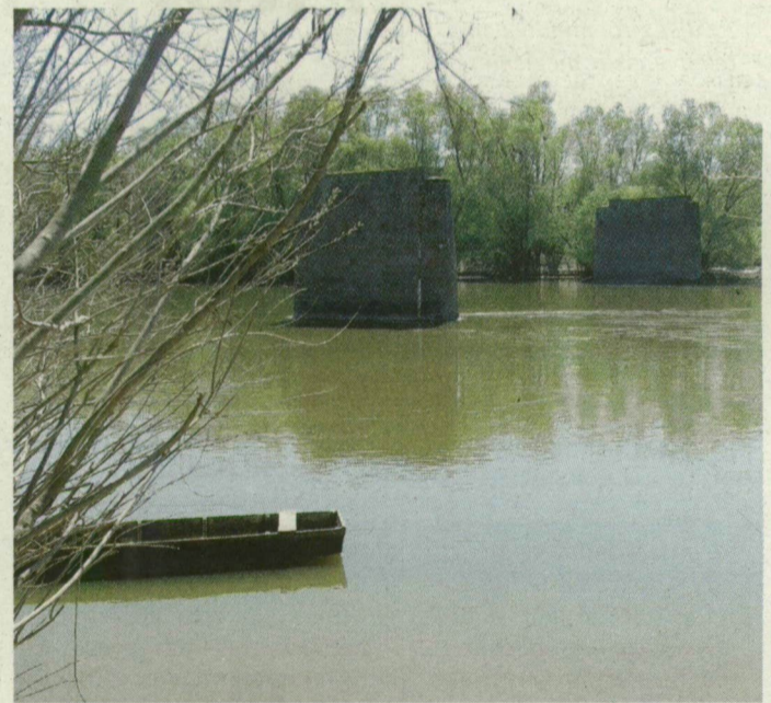
Az egykori Maros-híd maradványai. Ha helyreállna az összeköttetés, talán munkát is könnyebb lenne találni.

akarnak! –, azt csak úgy teheti meg, ha Kiszombornál átkelnek, és végigcsörtetnek Makón. Ha azonban megépül a Szent Gellért híd és a hozzá tartozó út, a Temes megyeiek ezen keresztül fölhajthatnak az M43-asra: nem kell bemeniük a városba.