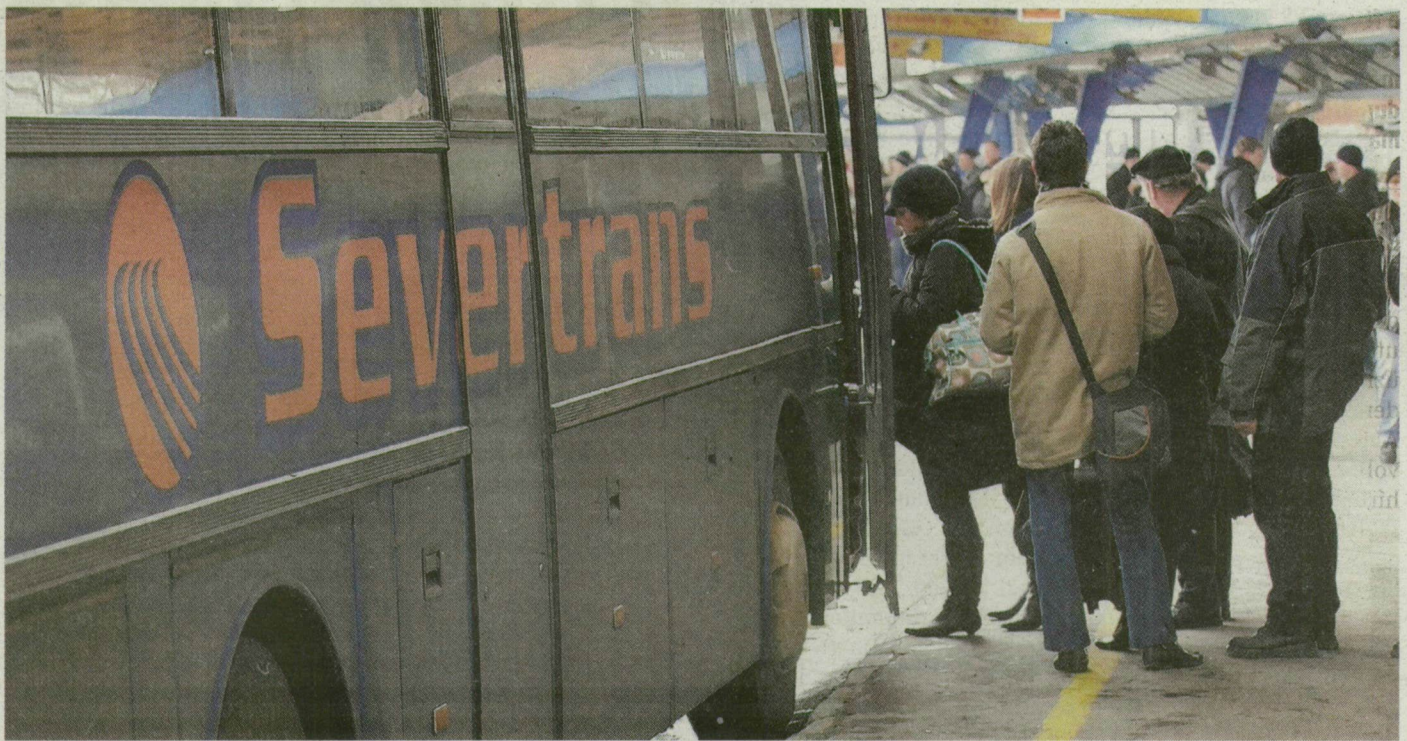
A Tisza Volán mellett a szerb Autobanának és a Severtransnak is van járata Szeged és a Vajdaság között. Utóbbi busza 14 órakor indul a Mars térről.

ként kiderül, ez mit is jelent. Feri ismeri a zentai magyar könyvkiadó vezetőit, akiktől jövők, de a Délmagyarország híreivel is tisztában van. Tanácsot ad, hol érdemes Horgoson beváltani a Zentán kapott dinárt forintra, mert ott hon már nehezebb. Beszélget, érdeklődik, nem tola-