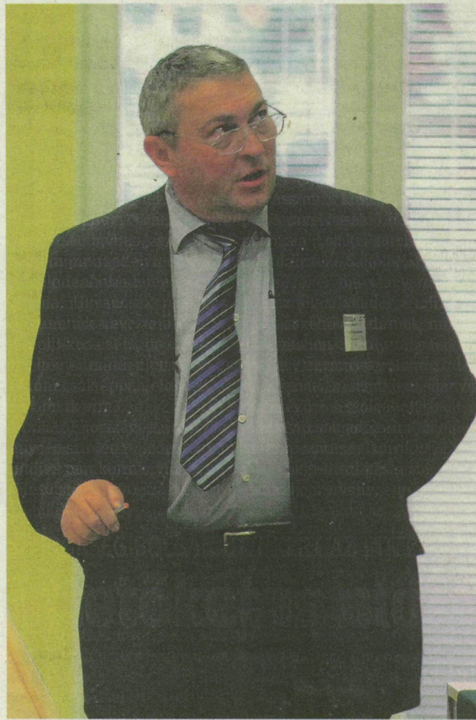
Genetikailag kimutatható, ki lesz kövér. A professzor szerint, ha odafigyelünk rá, egészségesebb lesz a következő nemzedék.

pont. Angliából, Szlovákiából és Norvégiából kapunk segítséget. Ha sikeresek lesznek a