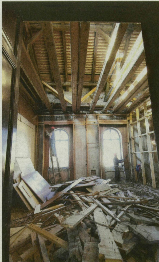
Nádréteg levéve, a falak itt nagyobb helyen kivájva – épül-szépül a Dugonics téri rektori hivatal.

– November elejétől tudtunk elkezdni nagyobb ütemben dolgozni, és okoztunk nem kis felfordulást bent is, kint is – fogalmazott Neme-