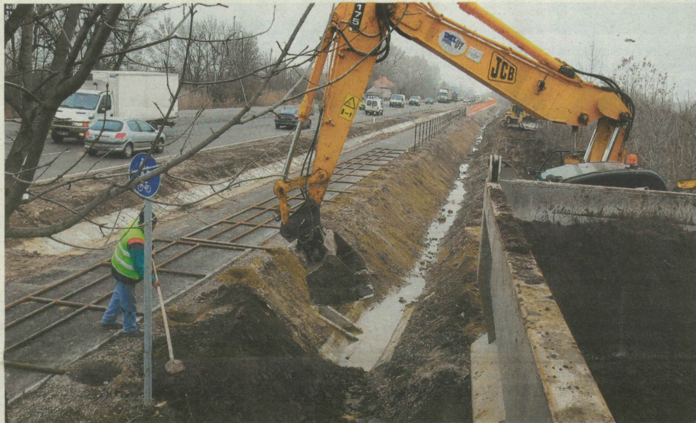
A kivitelezők tegnap még dolgoztak a kopáncsi szakaszon.

HŐDMEZŐVÁSÁRHELY. Ma déln megnyitják az autósok előtt a 47-es főút Kishomok és Kopáncs közötti 4,5 kilométeres, kiszélesített szakaszát, így Szegedtől Vásárhelyig már 4 sávon lehet közlekedni. 8 évig