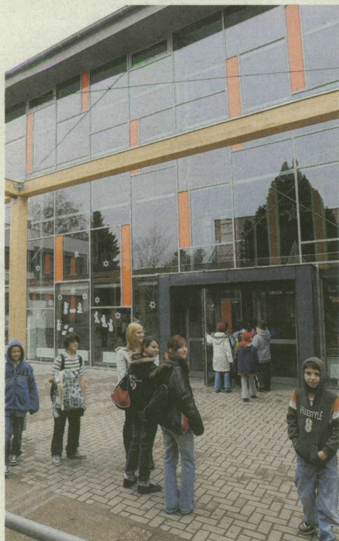
A szőregi iskola üveghomlokzata a szegedi egyetem Ady téri tanulmányi és információs központjára emlékeztet.