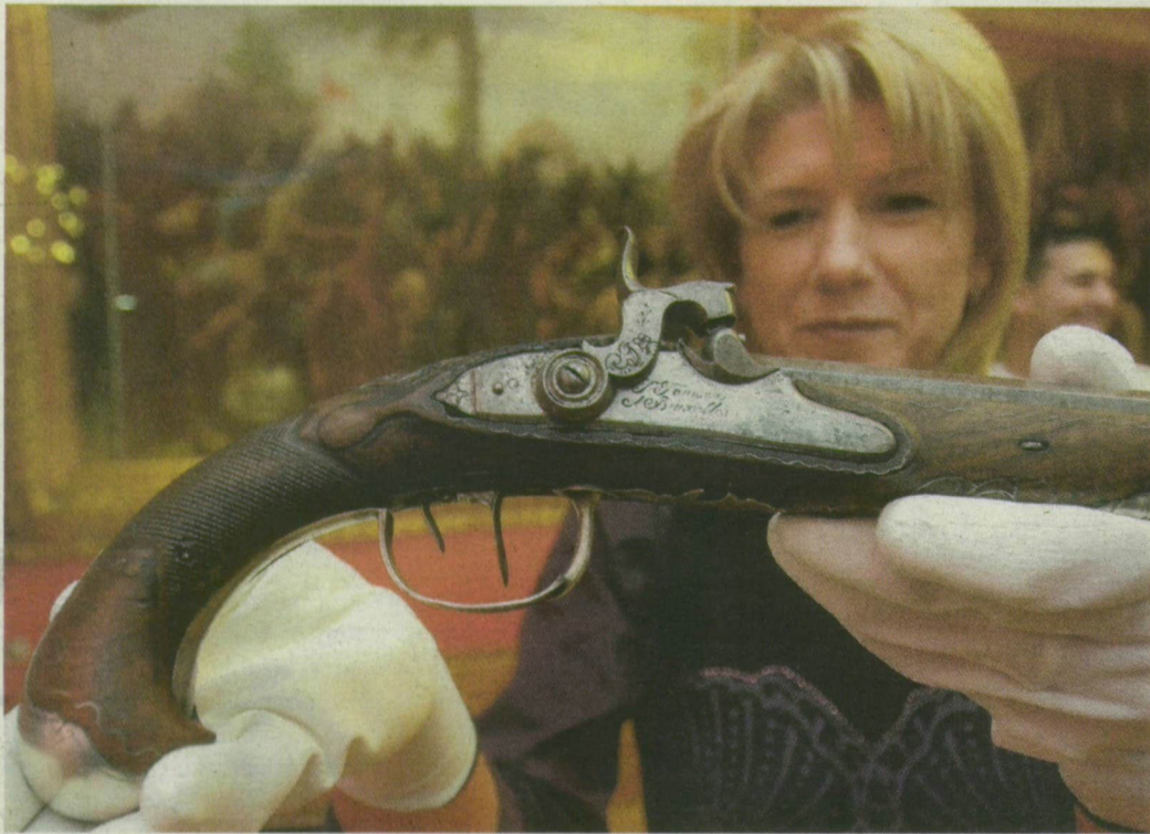
Egyedül Kiss Ernő tábornok pisztolyát volt szabad kesztyűs kézbe venni.