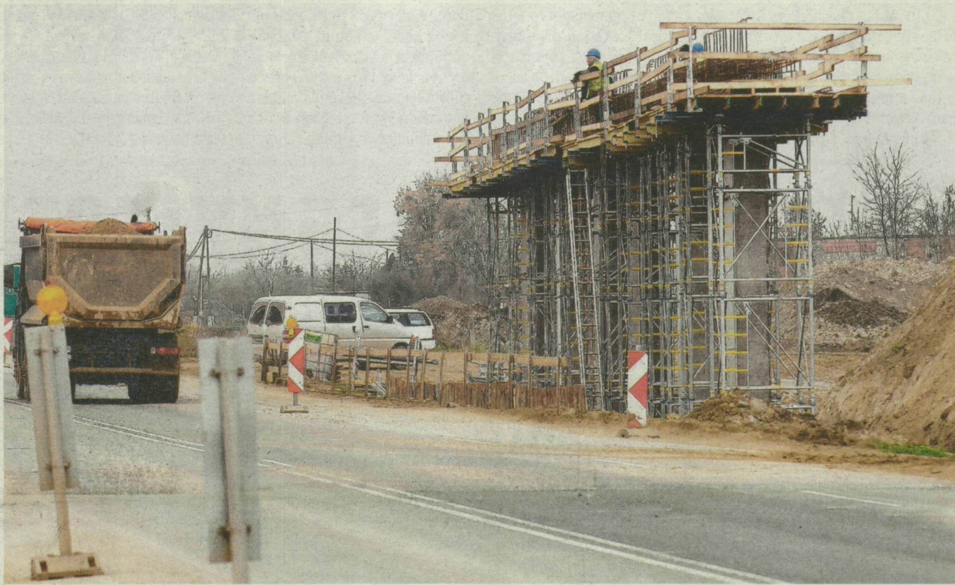
Még tart a türelem és a bizalom is: április elsején azonban készen kell lennie az első szakasznak és a felüljárónak is.