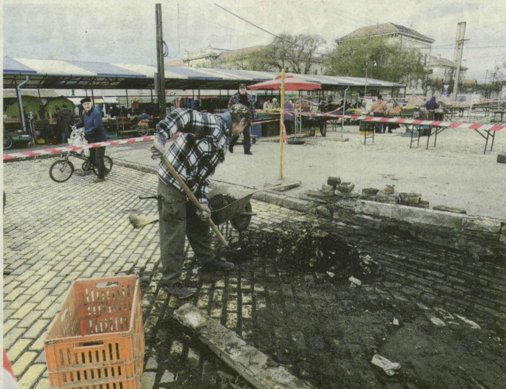
Az eltávolított bódék helyén maradt szemetet takarították el tegnap a piacon.

Úgy tudjuk, vasárnap estétől tegnap hajnali 5 óráig dolgoztak a Mars téren. Miért az