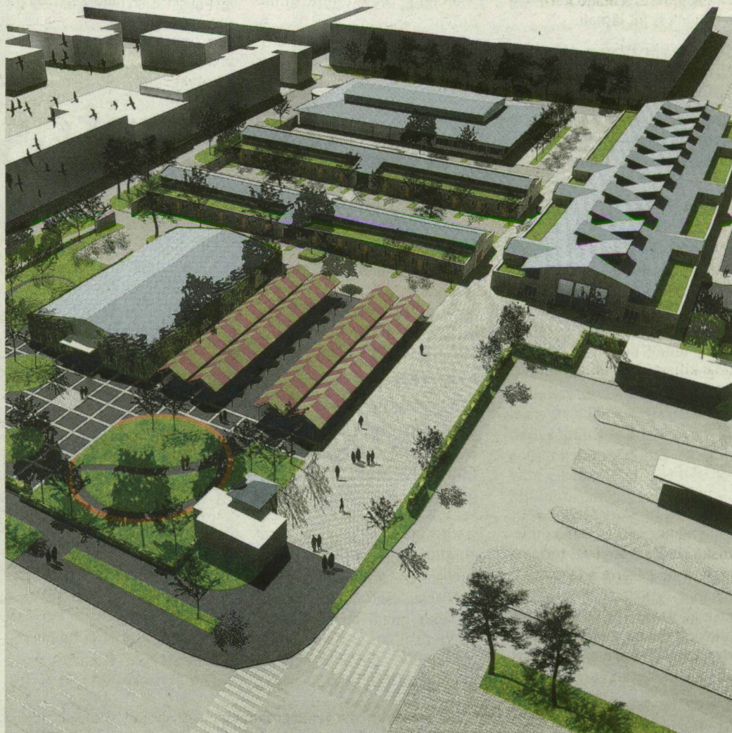
Látványterv a nagykörút felől. Az új nagycsarnok a mostani asztalos piac helyén lesz.