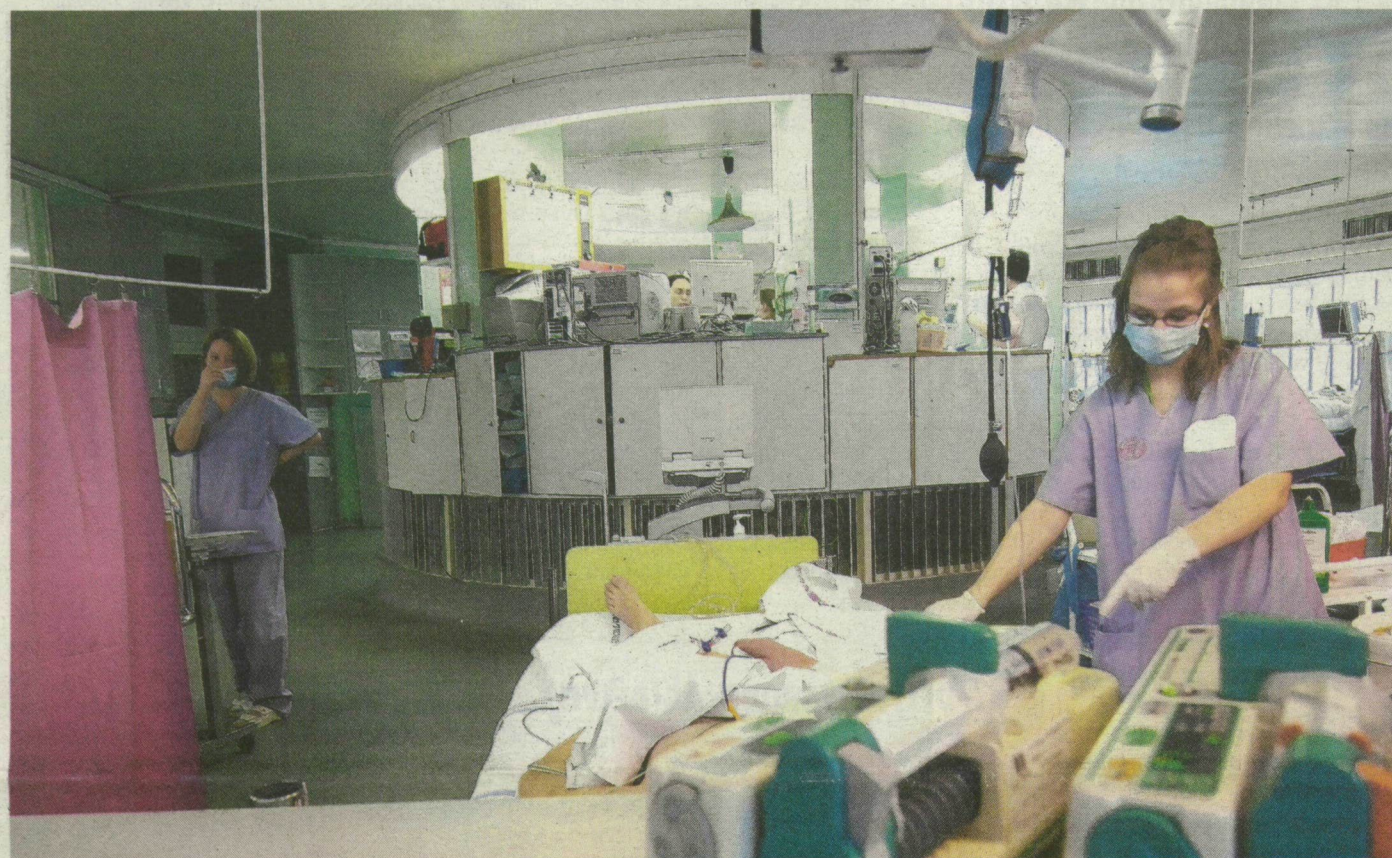
A szegedi körintézményen ápolják az újinfluenza-betegeket. A H1N1 vírus légzési rendellenességet okoz.

Eddig öt új influenzást, köztük két várandós nőt ápoltak új módszerrel is alkalmazva Szegeden az intenzív osztályon. A súlyos állapotba került betegek között világszerte 10–15 százalék a terhesség aránya – Pál Attila, a nőgyógyászati klinika igazgatója minden kismamának beadatná a védőoltást.