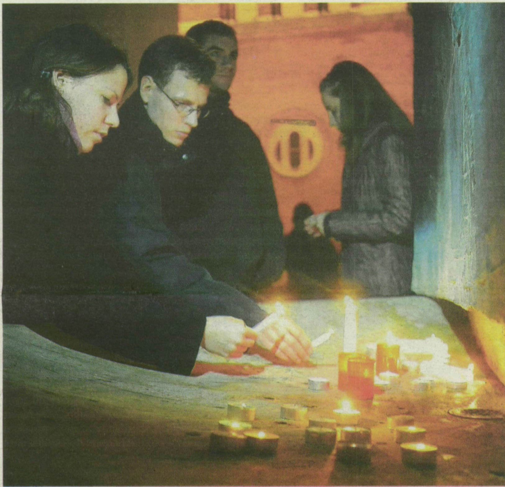
Több tucat láng lobbant tegnap a lelőtt pécsi gyógyszerészhallgató emlékére Szegeden, a Dóm téri egyetemi épület előtt.

A lelőtt pécsi egyetemista, a csütörtöki tragédia áldozatainak emlékére mécseseket gyújtottak tegnap este Szegeden. A baranyai megyeszékhely polgármestere szigorítaná a fegyverhasználat szabályait.