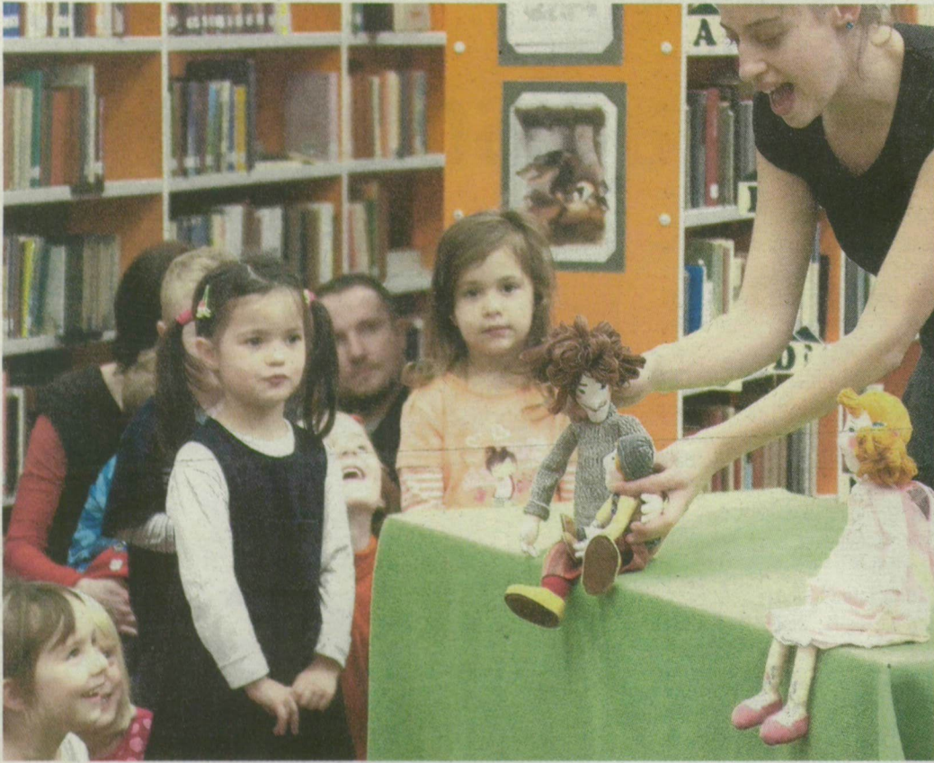
A gyerekek élvezettel figyelték a bábok játékát.