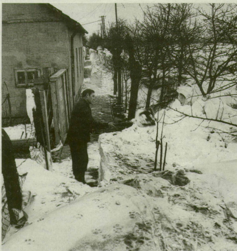
Dombnyi hótorlaszok. Petőfitelep szélső utcájában, a Gerle soron a járda: háromméteres hófal közti „szoros”. Aztán: idill.

Február 7.: A Challenger amerikai űrrepülőgép 10. misszióján az első köldökzsinór nélküli űrséta. Február 8.: Megkezdődik a XIV. Téli Olimpia Szarajevóban. Július 28.: Los Angelesben megnyitják a XXIII. nyári olimpiát. A szocialista országok, Románia kivételével, távol maradnak. Ez a második alkalom, hogy magyar csapat nem vesz részt olimpián. Október 19.: Elrabolják Jerzy Popieluszko ellenzéki papot Varsóban. Holttestét november 3-án találják meg, temetése rendszerellenes tüntetéssé válik. December 19.: Kína és Nagy-Britannia aláírja a megállapodást Hongkong jövőjéről; az átadást (1997) követően „két rendszer, egy nemzet”.