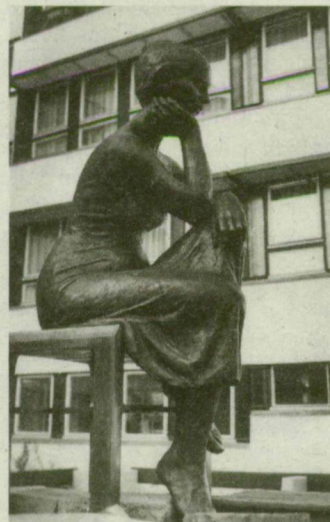
Lapis András széken ülő nőalakja. A Köjál-székház belső udvar egyenesének merevségét oldja.

merevségét jól oldják a finom, nőies formák, a drapéria lágy esése, a merengő tekintet, mint ellenspontok.”