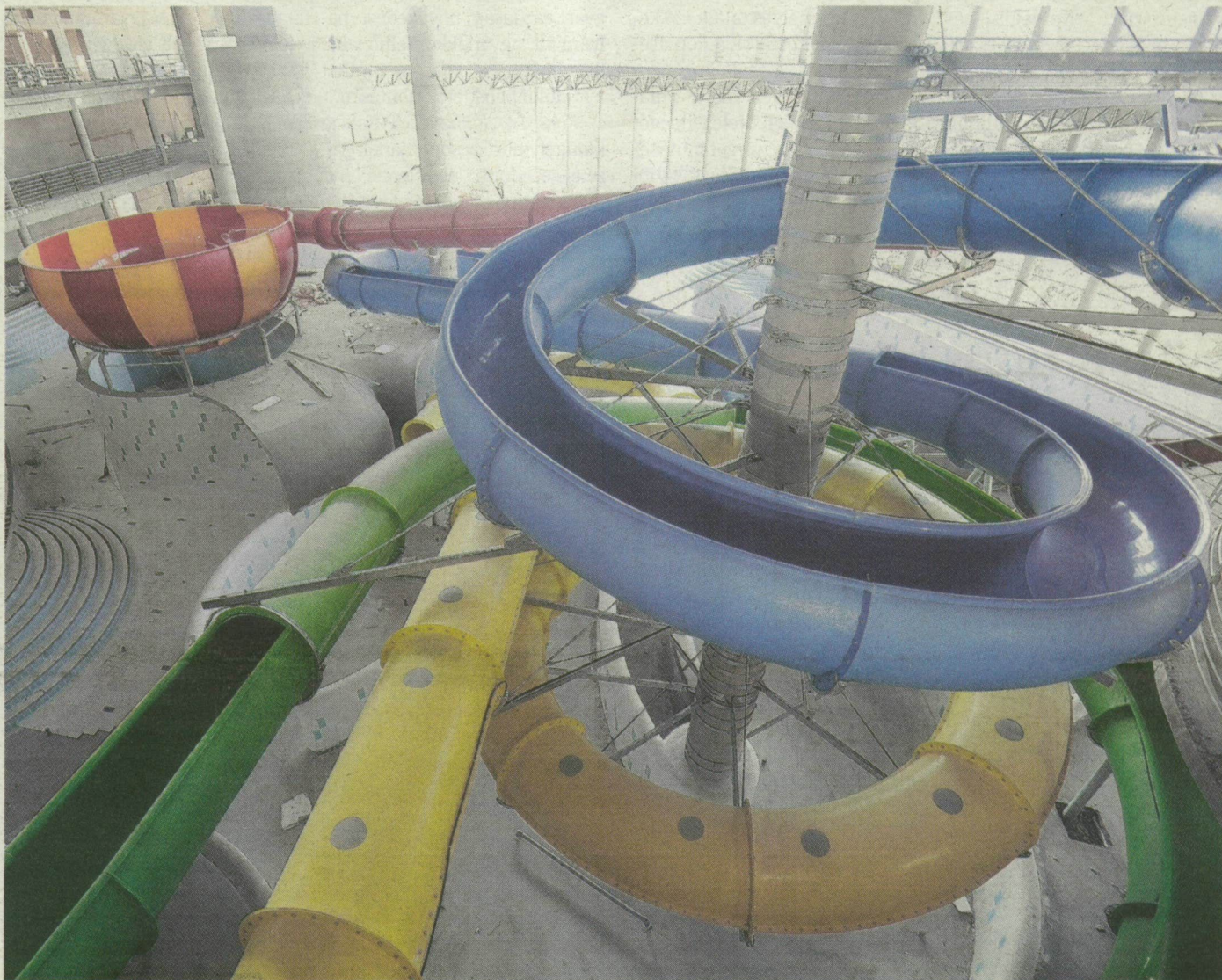
A csúszdák különböző színűek, a két leghosszabb 270 méteres.