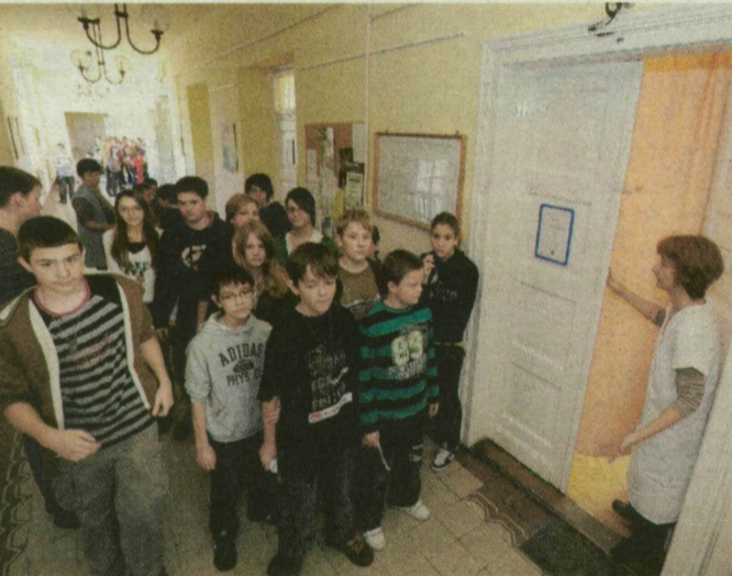
A szegedi Rókus I-es általános iskolában is csoportosan oltották be tegnap a gyerekeket.

például egy intézményben, iskolai osztályban sokan betegszenek meg influenzás tü-