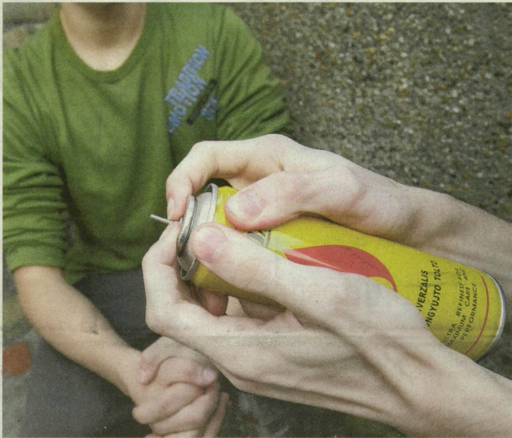
Kábítószerként használják a fiatalok a legálisan beszerezhető, öngyújtók töltésére való gázt. Pedig belehalhatnak. ILLUSZTRÁCIÓ: SEGESVÁRI CSABA