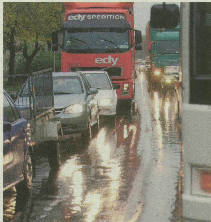
Araszolnak az autók a csillogó aszfalton.

SZEGED. A csaknem egy hete tartó esős idő tovább nehezíti a terelések miatt lelassult közlekedést a városban. A még mindig zömmel nyári gumikkal felszerelt autósok óvatosan araszolnak, hiszen az út csúszik az aszfalra felhordott sártól és a hulló fale-