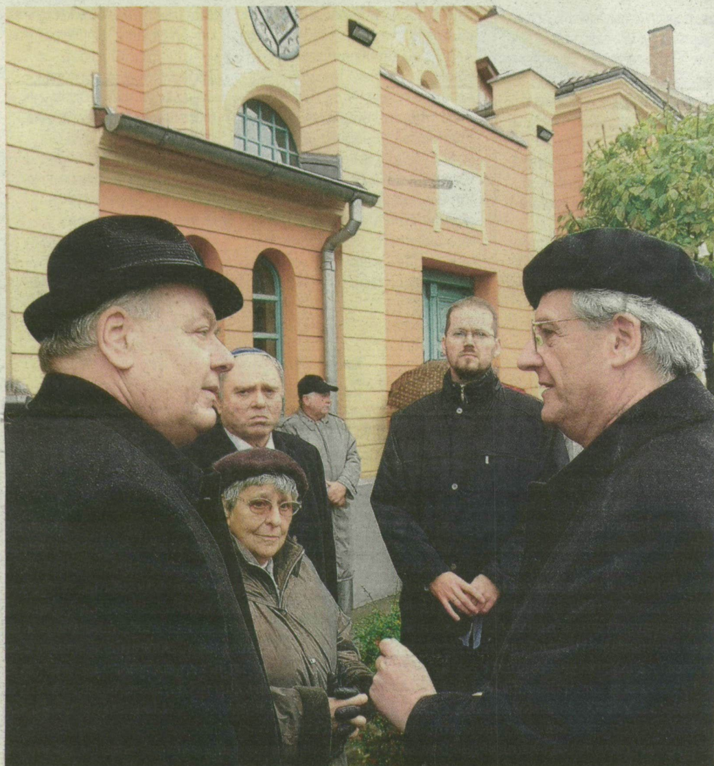
Buzás Péter (balról) Sólyom Lászlóval beszélget a makói zsinagóga előtt, Ferge Zsuzsa társaságában.

Sólyom László köztársasági elnök tegnap Makón megkoszorúta Kecskeméti Ármin főrabbi új emléktábláját. Ily módon tiltakozott az erőszak és a barbárság ellen. Az államfő az SZTE egyetemnapjén két köztársasági gyűrűt adott át.