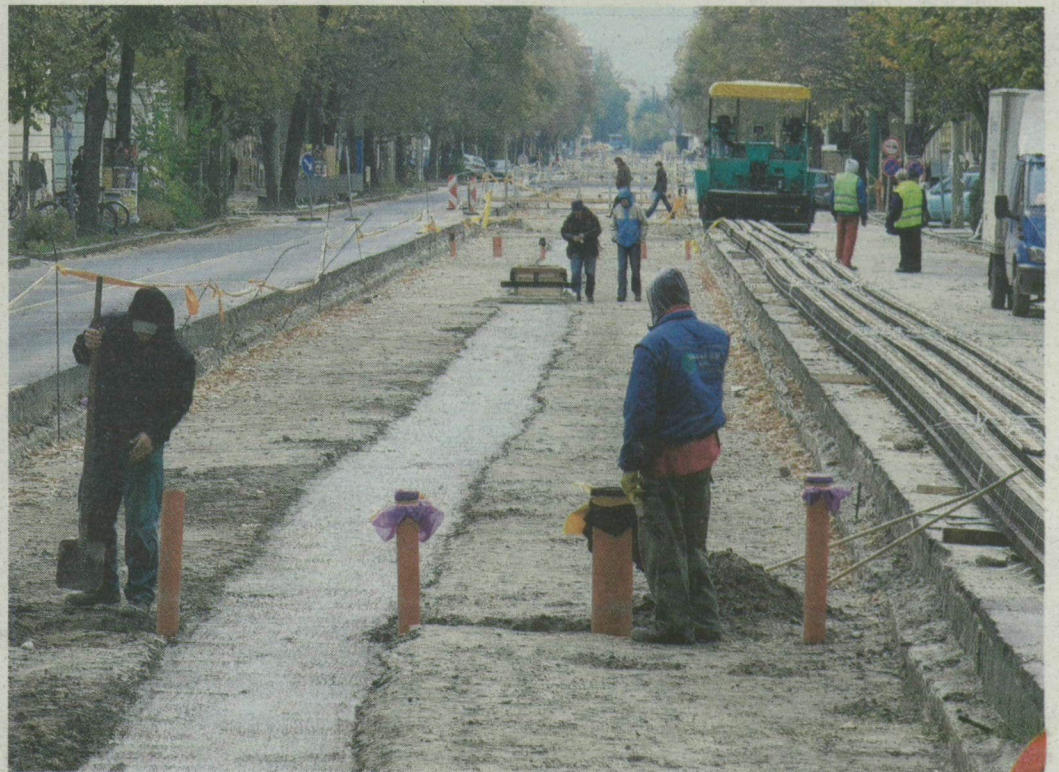
Pillanatkép a Boldogasszony sugárútról október 22-éről és tegnaptól. A már beszintezett vágányokat fel kellett szedni, mert gond van a sínek alapjával. Nem lehet tudni, hogy ez mekkora csúszást jelent.

SZEGED. Már biztos, hogy nem adják át az eredetileg tervezett határidőre az 1-es villamos felújított pályáját és a rókusi csomópontban épülő körforgalmat. A Boldogasszony sugárúton novemberben, a Kossuth Lajos sugár-