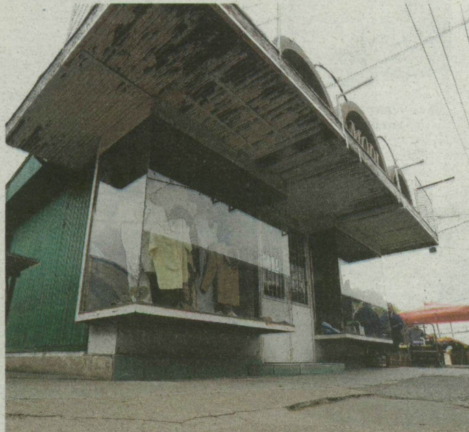
Van, aki 200 millió forintot kér egy 40 négyzetméteres pavilonért a Mars téren.

A 40 millió forint önmagában is egy szerényebb újszegedi ház ára, de 200 millióért