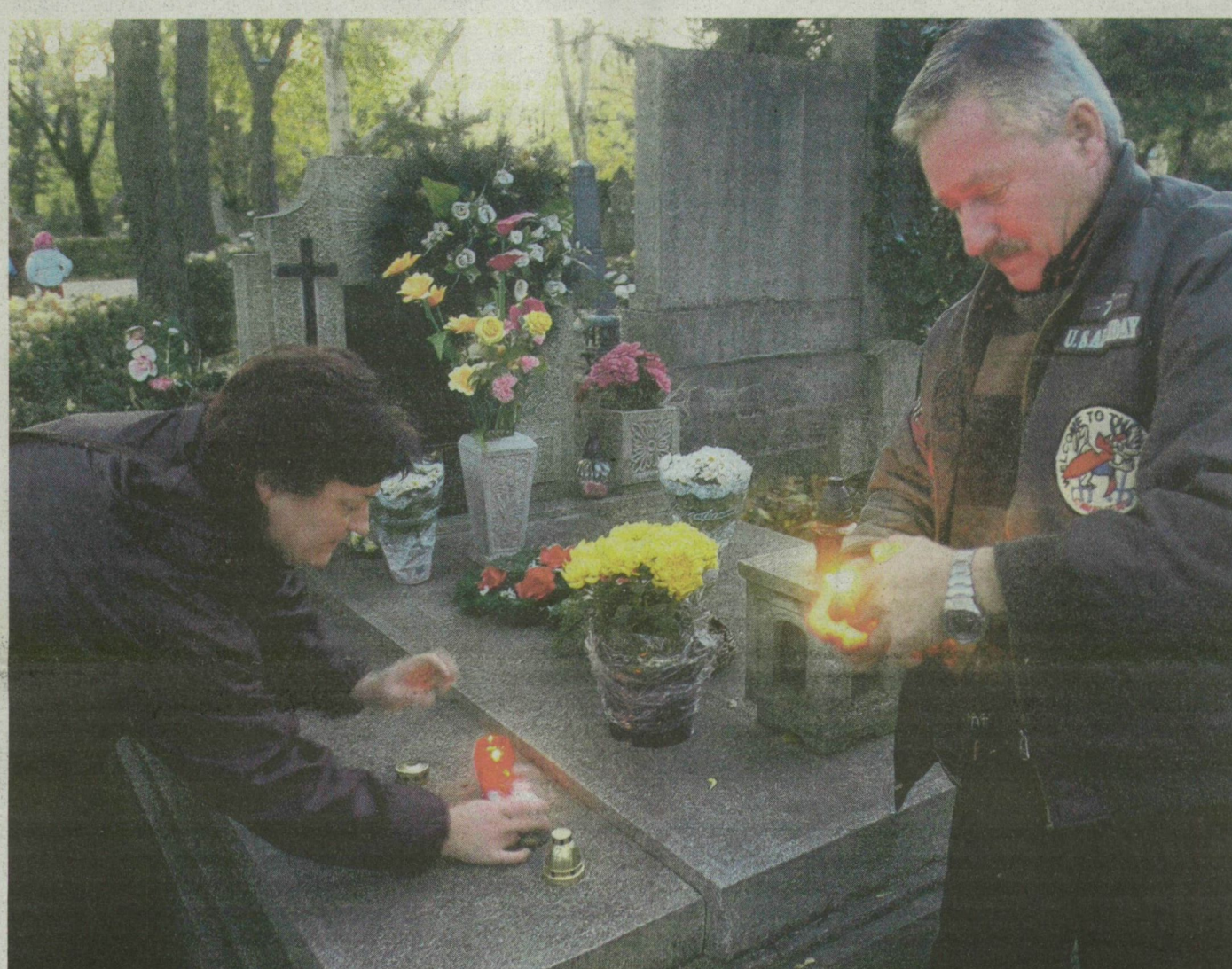
Bozókikék is meggyújtották gyertyáikat a szegedi Belvárosi temetőben.

Sokan keresik fel a meghosszabbított nyitva tartású sírkerteket a hétvégén, hogy mindenszentek ünnepe és a halottak napja alkalmából elhunyt szeretteikre emlékezzenek. A rendőrök, polgárőrök fokozottan figyelnek a rendre, a közlekedésre. Több városban forgalmirend-változások is lesznek. Írásaink a 3. oldalon és a Napraforgó mellékletben