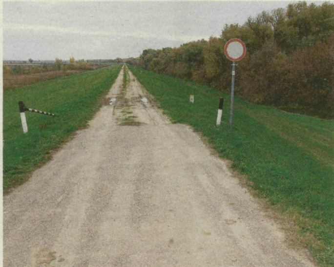
A Tisza töltése Rőszkénél. Idáig jutott el két kisgyermekével a 29 éves férfi.

volna, és a jobb élet reményében hagyta el szülőföldjét. Rájuk vagy kitoloncolás, vagy – amennyiben menekültstátusért folyamodnak – a békéscsabai befogadóállomásra való szállítás vár.