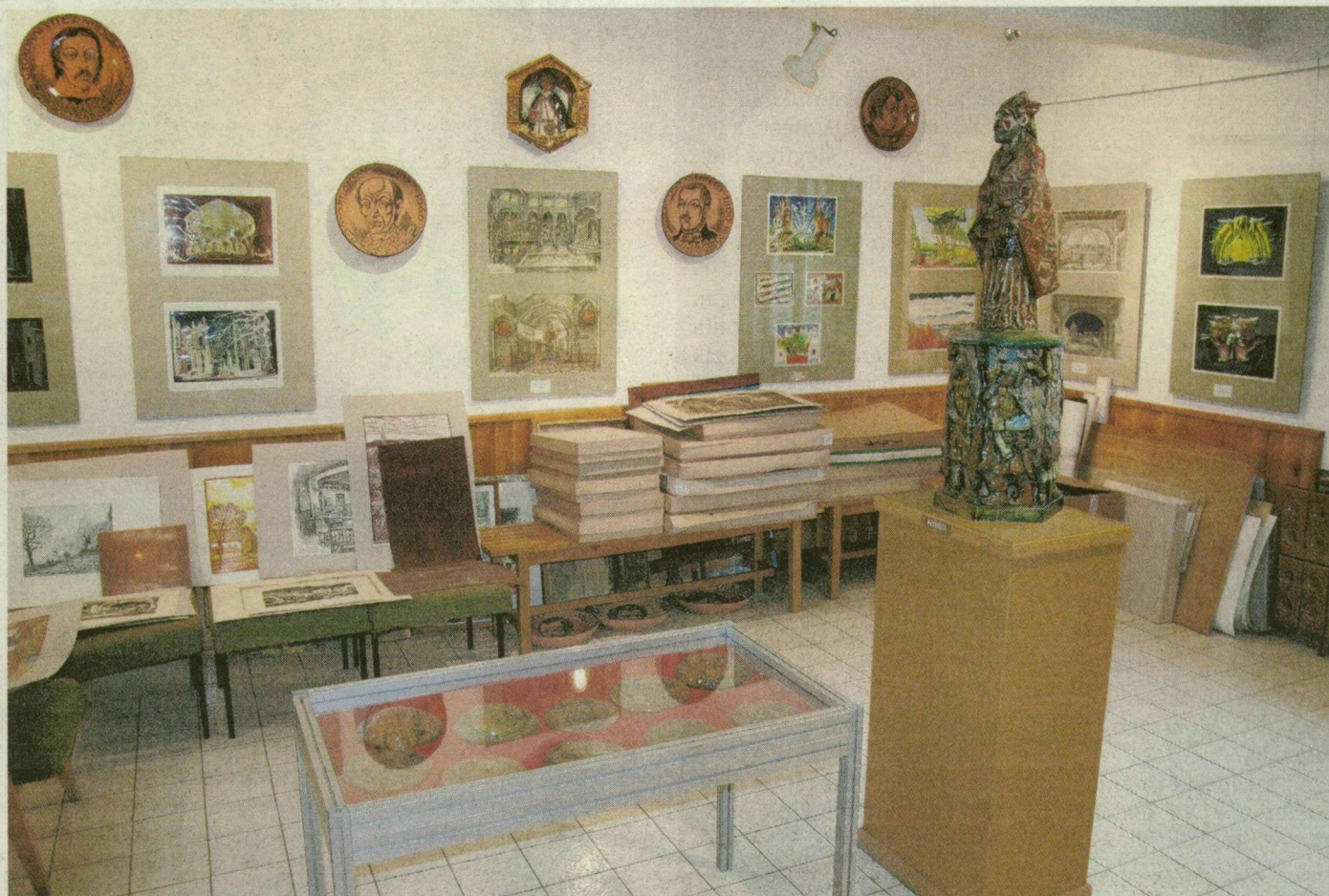
Három éve, bezárása előtt így nézett ki a Varga Mátyás alkotásait bemutató egyik kiállítóterem.

– A megnyitása óta eltelt húsz évben nem csináltak semmit az épülettel. Az illemhelyektől kezdve a tetőig minden