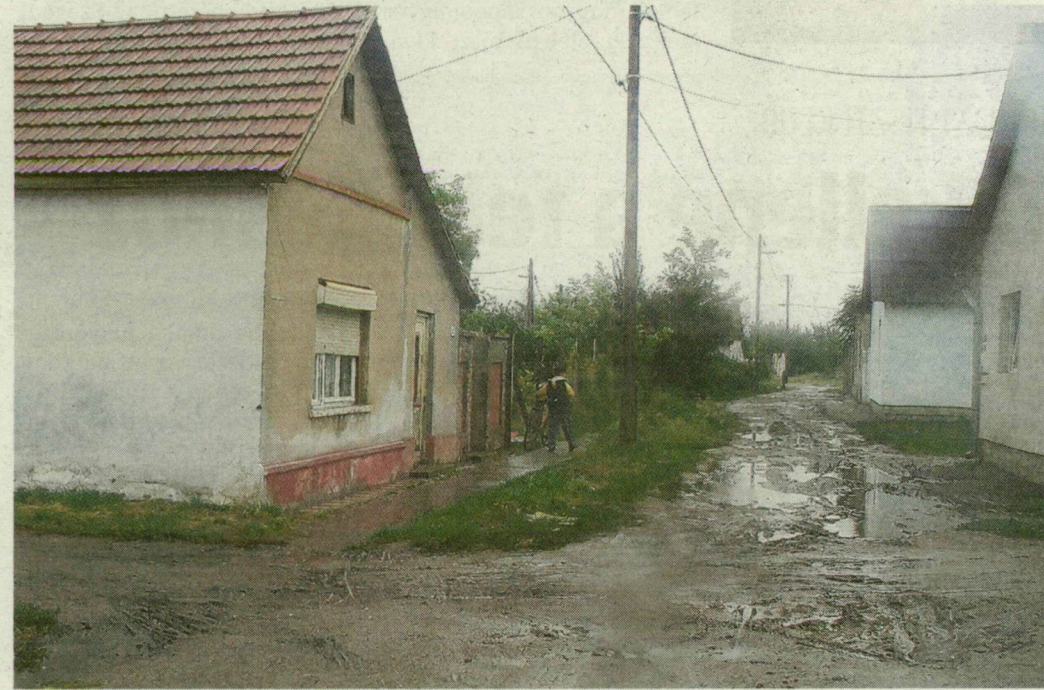
Földes utca Makó Honvéd városrészében. Már csak hat maradt.

Hamarosan teljesen eltűnnek a földes utcák a megye városai közül. A legjobb helyzetben Szentes van.