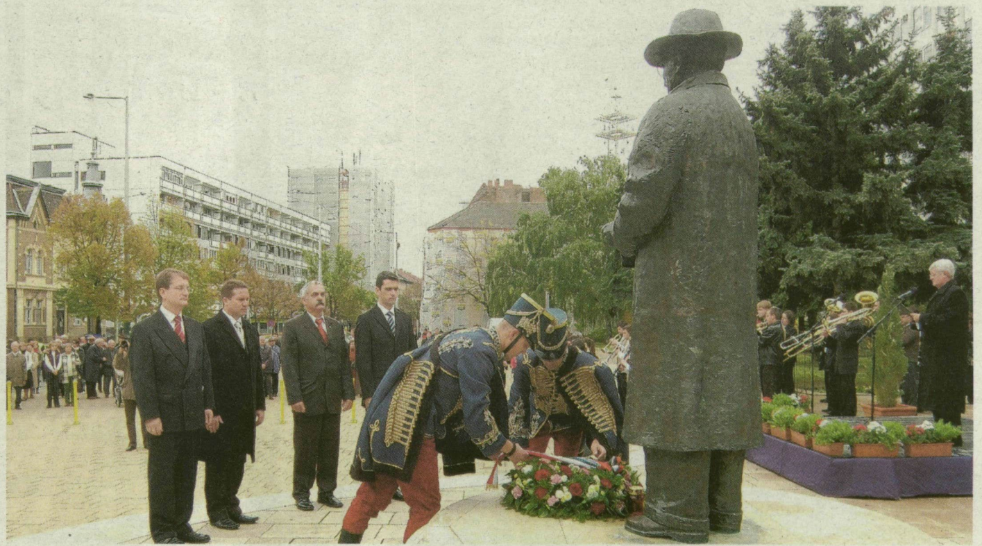
A szegedi önkormányzat, országgyűlési és helyi képviselők, pártok, civilszervezetek koszorúztak a Nagy Imre-szobornál.