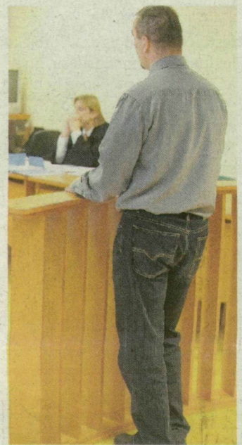
Meghallgatta a bíróság a határrendészt.